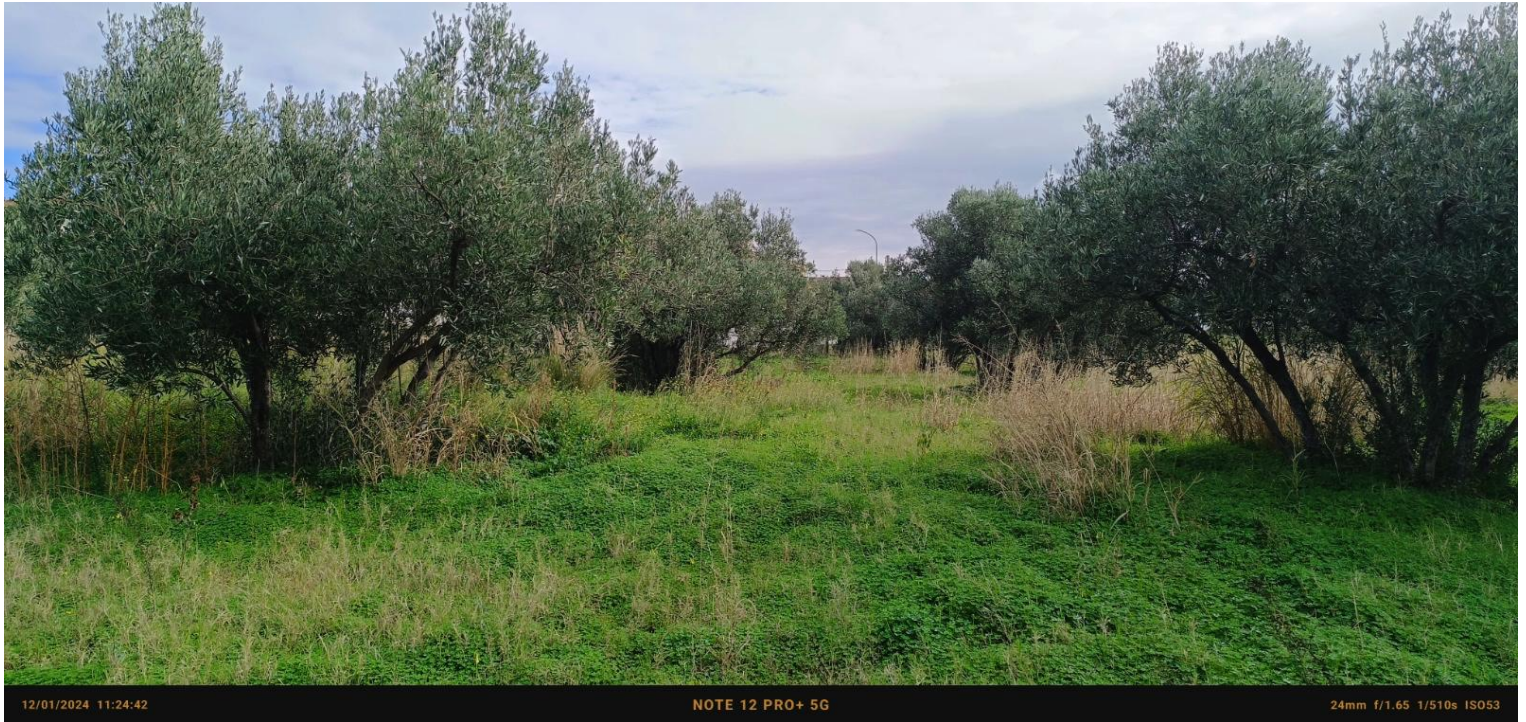
FOTO N.7 - 12 gennaio 2024