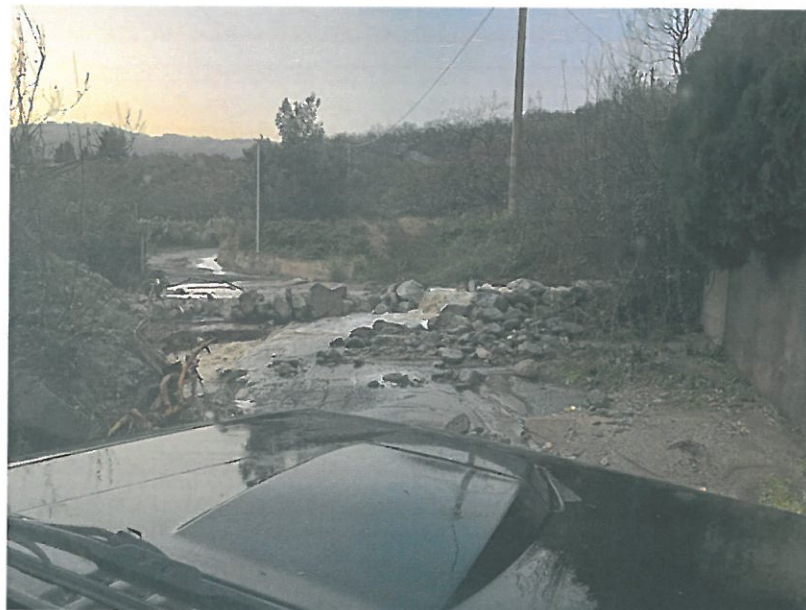
Fotografia N. 1